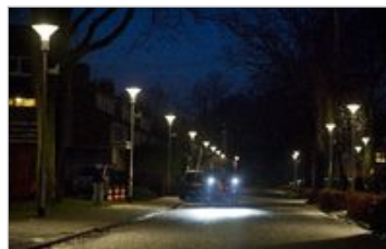
In Berkel Enschot gaat de ledstraatverlichting feller branden als er fietsers en voetgangers passeren.

Hij ontwikkelde het systeem als eerste in de wereld, in samenwerking met de TU Delft. „Het is niet zo dat eerst de ene en dan de andere lamp aangaat. Het licht